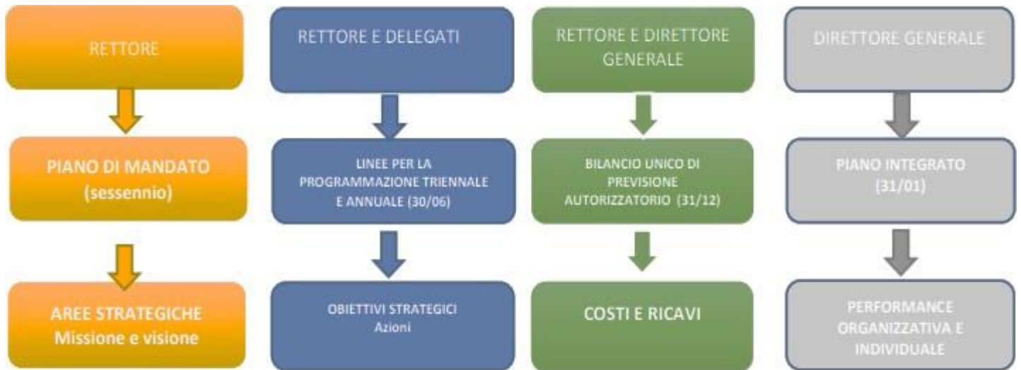
Figura 1 Quadro dei principali documenti di programmazione, con fasi ed attori

attori - Figura 1”, abbracciando le linee di indirizzo (strategia), le modalità con cui realizzarle (performance) e le risorse necessarie (bilancio).