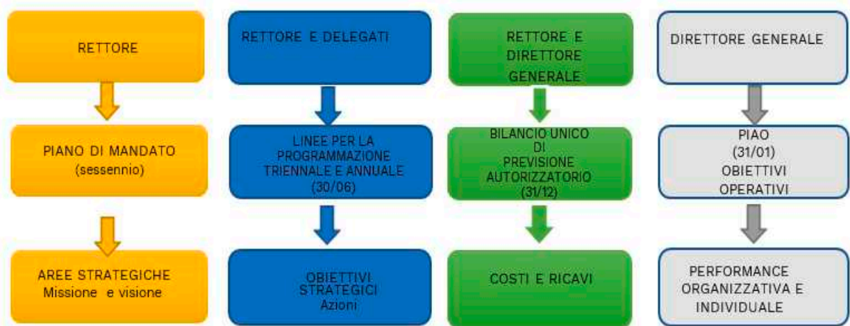
Figura 1 Quadro dei principali documenti di programmazione, con fasi ed attori

Ai sensi dell'art. 23 del Regolamento di Ateneo per l'Amministrazione, la Finanza e la Contabilità, il Direttore generale, entro 10 giorni dall'emanazione delle Linee per la programmazione triennale e annuale, definisce il calendario delle attività per la formazione del Bilancio. Di seguito si riporta il "Calendario di massima delle attività bilancio – performance".