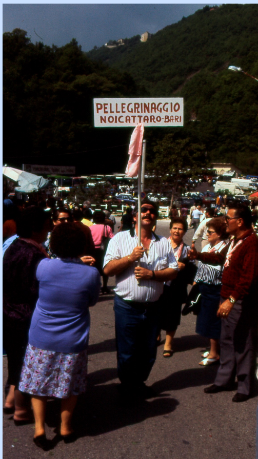
Pellegrinaggio al santuario di S.. Rita a Cascia