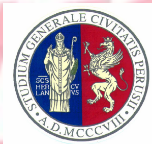
Facoltà di Scienze della Formazione