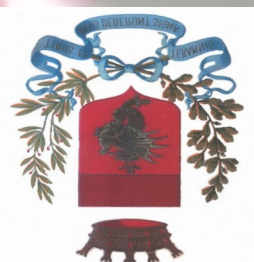
Comune di Terni